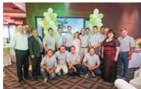
Екипът на Универсал - НВГ

помага предлаганата от тях техника предварително да бъде изпитана на техните полета.